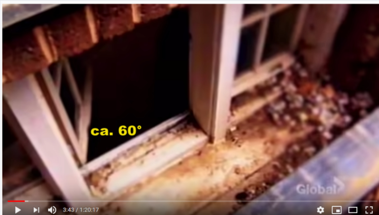
The Case of: JonBenét Ramsey - Part 2

Wichtig ist also zu wissen: Weil das Fenster sich nur 60 Grad öffnen lässt, muss der Eindringling sich ebenfalls schräg positionieren.