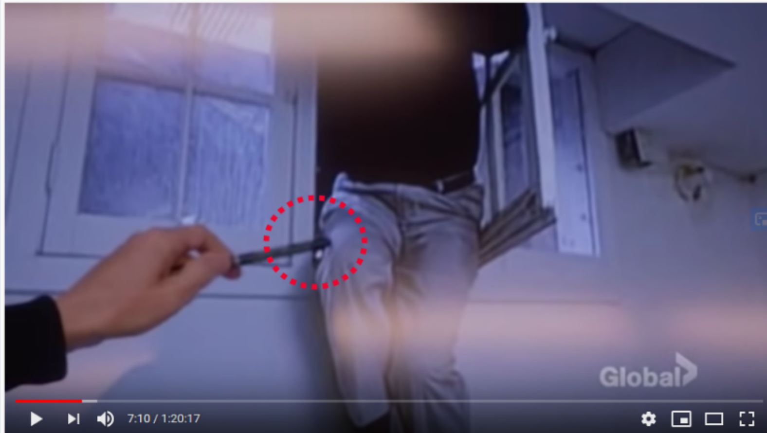
The Case of: JonBenét Ramsey - Part 2

Sie sehen die Hand eines Ermittlers von der „Mördereltern-Fraktion" wie er mit seinem Stift auf das Standbild eines Videos deutet, bei dem ein Ermittler der „Eindringling-Fraktion" demonstriert, wie ein Erwachsener durch das Kellerfenster eindringen konnte, auch wenn es sich nicht weiter öffnen lässt als hier zu sehen.